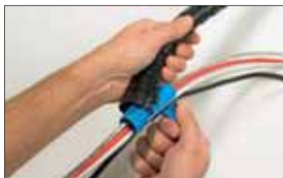
Trekk deretter ganske enkelt monteringsverktøyet gjennom Helawrap.