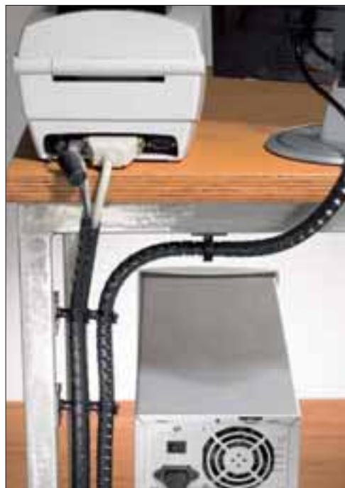
Komplett utvalg for hjem- og kontorapplikasjoner.