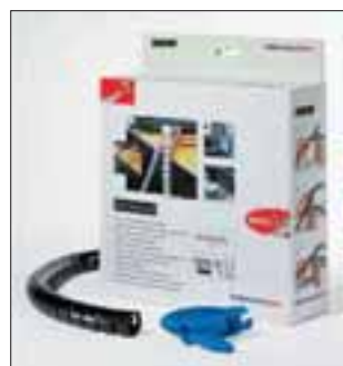
Helawrap, den raske og enkle løsningen for å rydde opp i kabelkaos, tilgjengelig i 2 størrelser og 3 farger

Alle dimensjoner i mm. Med forbehold om tekniske endringer.