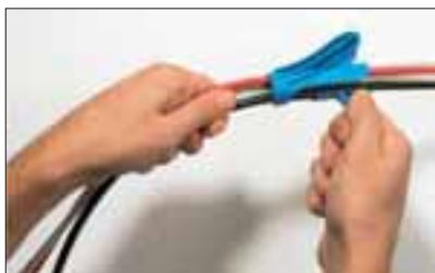
Legg inn en eller flere kabler i åpningen på monteringsverktøyet