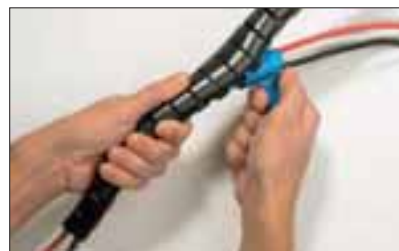
Plasser monteringsverktøyet i enden av Helawrap kabelbeskyttelse.