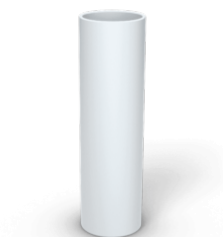
Skjøtemuffe 16 mm WT