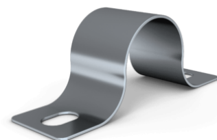
AP klammer 16 mm