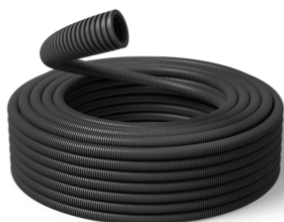
20 mm xSpeed UV 750N / R25