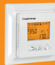
Comfortemp 760 TE