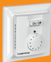
Comfortemp 740 TE