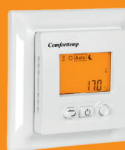
Comfortemp 750 TE